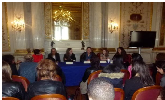
Conférence à l'Ambassade des Etats Unis, Paris

100 000 entrepreneurs Transmettre la culture d'entreprendre