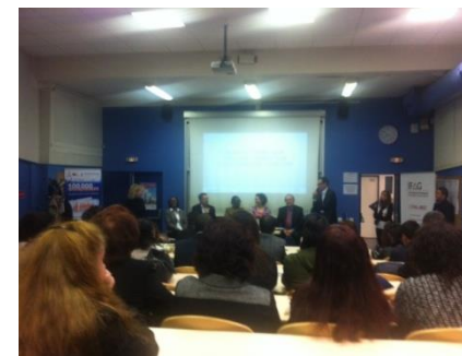
Soirée « L'entrepreneuriat & les femmes : additionnons nos différences » Lespritcom & l'IFAG, Paris