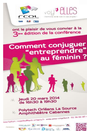
Conférence à PolyTech, Association Voyelles, Orléans