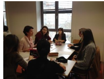
Forum à l'Université Catholique, Lyon