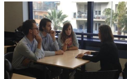
Forum à l'EDHEC, Nice