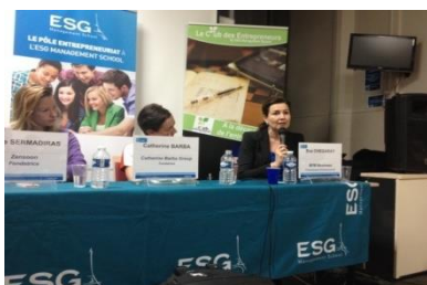
Conférence Master Class Entrepreneuriat, ESG, Paris

Pôle Étudiants Pour l'Innovation, le Transfert et l'Entrepreneuriat.