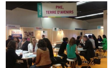
Forum au Salon Rencontres Universités Entreprises, Paris