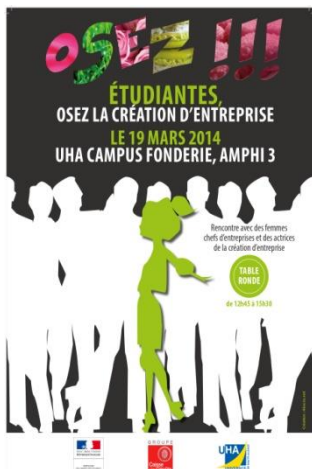
Conférence à l'Université Haute Alsace, Mulhouse