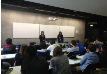
Forum à l'EDHEC, Lille