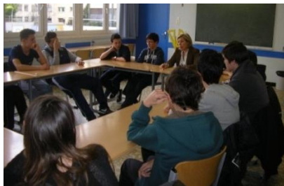
Forum au Collège Notre Dame de Lourdes, Paris