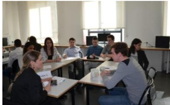
Forum au lycée Assomption Bellevue, Lyon