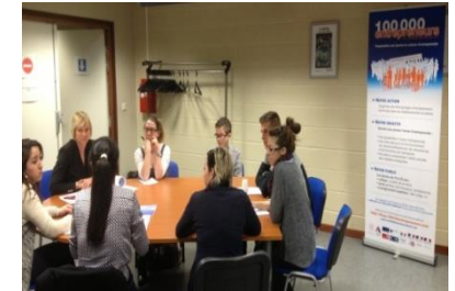
Forum à l'ULCO, Dunkerque