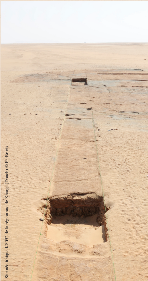
Site néolithique KS052 de la région sud de Kharga (Douch)