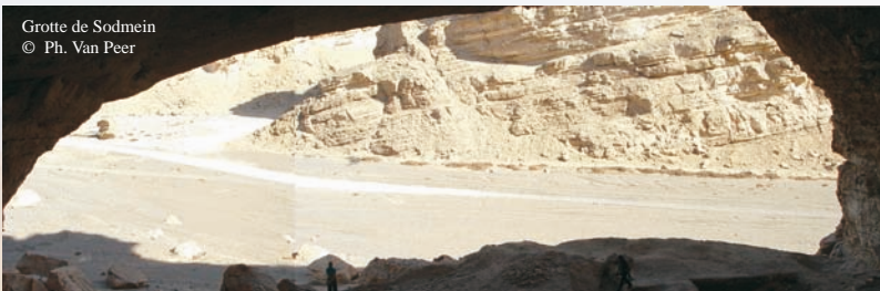
Grotte de Sodmein