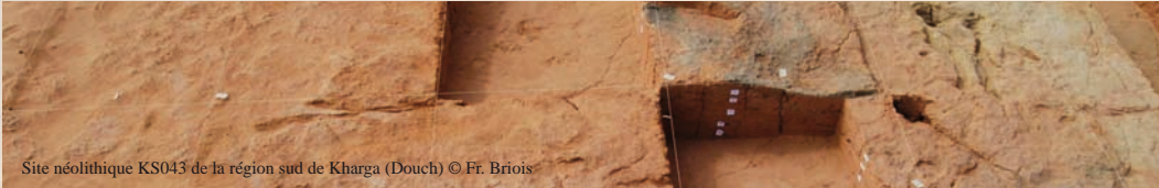
Site néolithique KS043 de la région sud de Kharga (Douch)