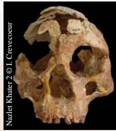
Nazlet Khater 2